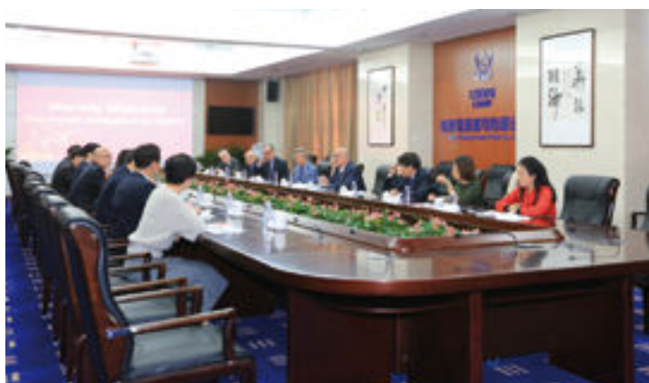
Délégations chinoises et françaises en réunion à Funging.

Ce rapport est disponible en français, anglais et chinois. Les réflexions entre les trois académies devraient se poursuivre en 2018 sur des aspects non traités dans cette première contribution.