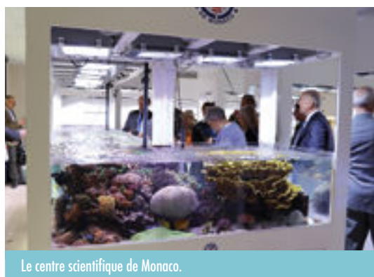
Le centre scientifique de Monaco.