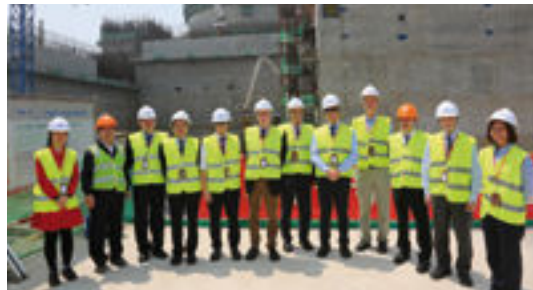
La délégation française sur le site du 1 er réacteur de conception entièrement chinoise Hualang One.

Télécharger Recommandations communes pour l'avenir de l'énergie nucléaire