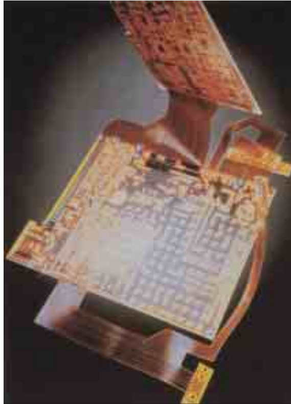
CI-DESSUS Circuit électronique.

Vis-à-vis du monde des PME, il faut revoir la structure d'information sur les transformations des organisations et des possibilités nouvelles offertes par les TIC. Les mesures de relance de l'investissement dans les TIC et d'accompagnement pour les jeunes pousses peuvent se référer au système américain SBIR (Small Business Innovation Research). L'atelier préconise également une présence française accrue dans les