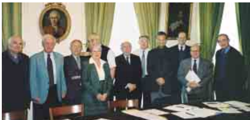
CI-DESSUS : Une réunion du conseil de l'Académie.