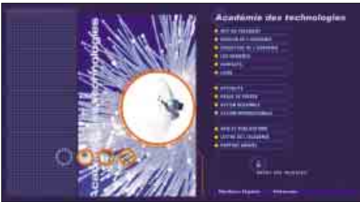
CI-CONTRE Sites intranet et internet de l'Académie.