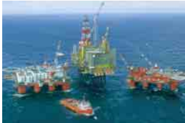
CI-CONTRE Plate-forme offshore TOTALFINAELF.