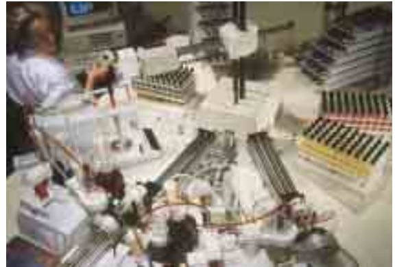
CI-DESSUS Robot de laboratoire.

Les concepteurs eux-mêmes doivent être formés pluridisciplinairement en sciences humaines, sciences de la vie et sciences dures, et à l'habitude de se plier au désir de convivialité des utilisateurs sans mélange ambigu entre ce qui est machine et ce qui garde à l'homme sa place de maîtrise et de contrôle. L'introduction de capacités décisionnelles conduit à étudier de nouveaux risques et à réfléchir sur les nouvelles responsabilités et la législation correspondante. Tout doit être fait pour que la machine augmente les degrés de liberté de l'homme sans l'asservir.